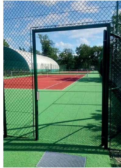
ces équipements de grande qualité », confie le président du club, avec une pointe de frustration.

L'an dernier, les deux courts en terre battue du parc de la Corbillière ont été entièrement rénovés et refaits en béton poreux. Financés par la Ville, le Tennis club de Mer et la Fédération française de tennis, ces deux terrains flambant neufs sont également équipés pour accueillir les personnes à mobilité réduite. « Nous sommes pressés de faire découvrir à nos adhérents