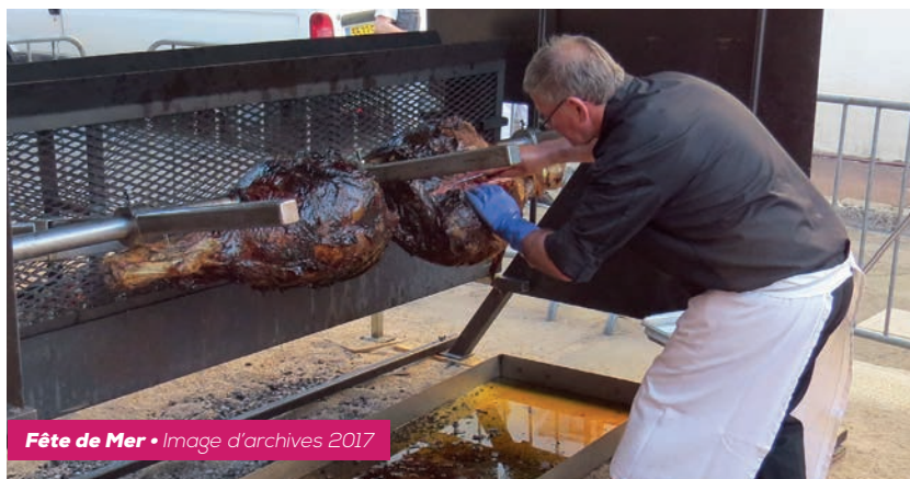
Fête de Mer • Image d'archives 2017

8 000 € de budget, avec l'orchestre, le traiteur et les boissons