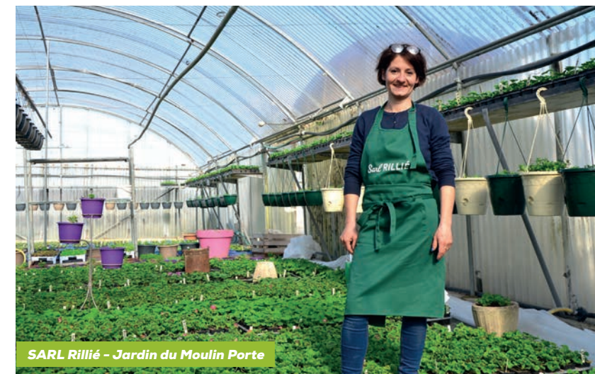
SARL Rillié - Jardin du Moulin Porte

Plusieurs variétés peuvent être plantées au printemps : petits pois, carottes, radis, navets, choux, ail, oignons, échalotes et fraisiers par exemple, ainsi que les premières pommes de terre. «Les experts auront fait germer leurs pommes de terre depuis janvier», souligne Laurent Girard, qui ajoute que les herbes aromatiques peuvent être semées dès la mi-mars. Sous tunnel,