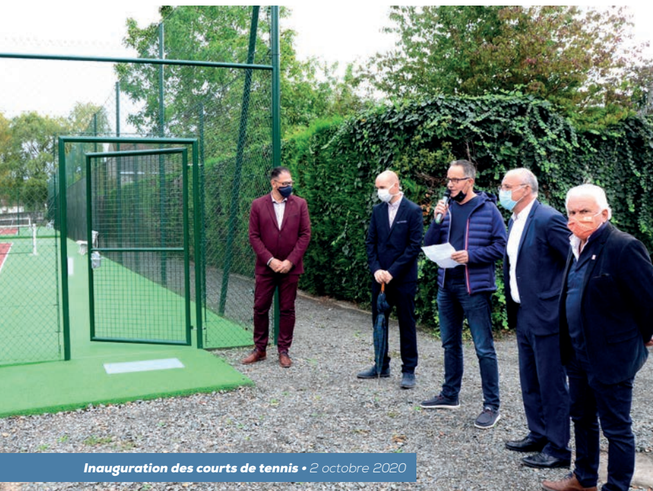
Inauguration des courts de tennis • 2 octobre 2020

« Nous sommes pressés de faire découvrir à nos adhérents les nouveaux courts de la Corbillière »